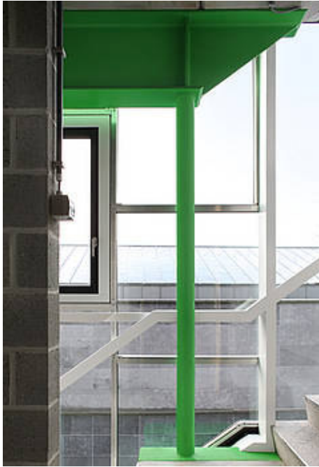
detail van het complex door Jan De Vylder

Opvallend genoeg doet de inbreng van vele actoren in het ontwerp niets af aan de artistieke verschijning van de productiehuzen voor Les Ballets C de la B en LOD. Zo kan de beschrijving tellen waarin de Bijloke site neergezet wordt als een koek waarbij het gebouw inspeelt op de zeventien gevels van het terrein, zodoende een deuk in de gevel erft en met enig wrikken op zijn juiste plaats komt. Ook de ontwerpmethodiek wordt teruggebracht tot eenvoudige formele operaties als 'knip knip knip' en 'schuiven draaien wringen'. Samen met de vele beeldimpresies op basis van kleuraccenten en ritmering in materiaal of verstilte situaties op de bouwwerf bieden deze aspecten het oeuvre van De Vylder alsnog een hoog artistieke waarde.