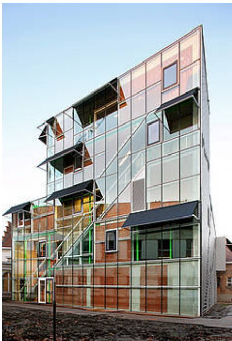
gevel van het complex door Jan De Vylder

omkadert, vandaag levert de architect het benodigde commentaar bij het werk van de curator.