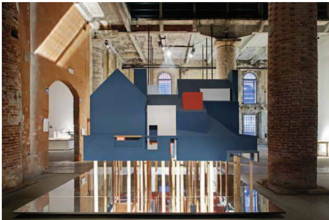
FOTO ONDER Veeartsenpraktijk Malper- tuus in Heusden, 2010